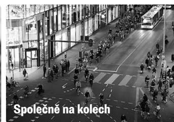
Společně na kolech