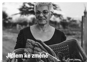
Jídlem ke změně