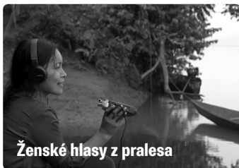
Ženské hlasy z pralesa