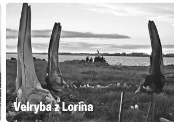
Velryba z Lorína