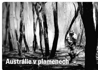
Austrálie v plamenech