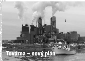
Továrna – nový plán