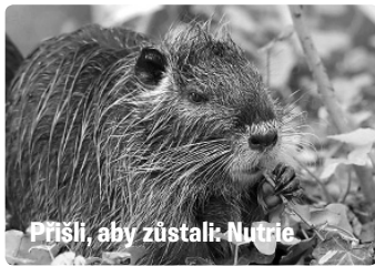
Přišli, aby zůstali: Nutrie

„Dramaturgický tým do letošní soutěže postavil z 207 přihlášených filmů soutěžní pětadvacítku, která kombinuje těžká a náročná témata s filmy nadějnými a odlehčenými. Ukazují vliv globálních změn klimatu na usychání lesů nebo živobytí pěstitelů kávy, ale nabízejí i návody, jak můžeme i ve 21. století žít v souladu s přírodou. Nevyhýbají se ani dopadům pandemie a lockdownů, které někdy mohou být až překvapivě pozitivní,“ komentuje výběr soutěžních filmů dlouholetý prezident festivalu Ladislav Miko.