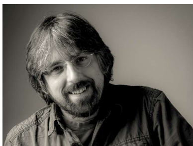
Porotce: Tomáš Hulík

Česká herečka, která je známá svým environmentálním přístupem, lásce k přírodě a všemu živému. Na svém kontě má desítky televizních, filmových a divadelních rolí. V současné době se svým partnerem založila divadelní spolek Zlom vaz.