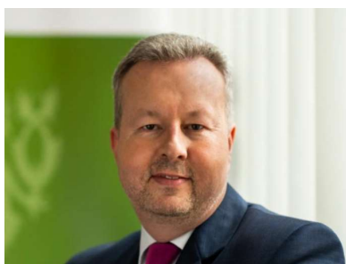
Ministr životního prostředí: Richard Brabec

Pořadatelem MFF EKOFILM je Ministerstvo životního prostředí, které bude na festivalu zastupovat ministr Richard Brabec.